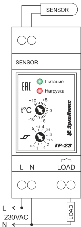
Схема 1. Подключение терморегулятора и нагрузки к общей сети питания

Подключение терморегулятора осуществляется по схемам, указанным ниже: